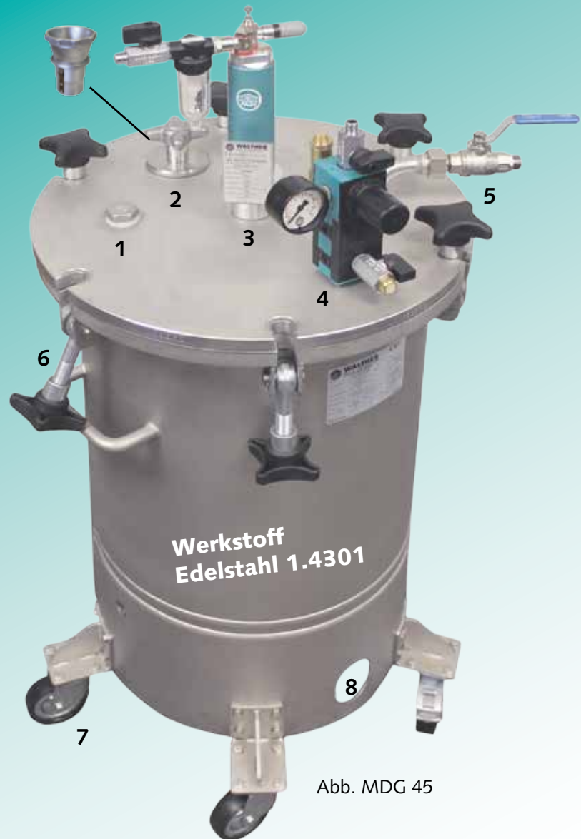
Abb. MDG 45

für MDG 45. Die Zurüstung empfiehlt sich insbesondere, wenn Rührwerke oder Sonden auf dem Deckel befestigt sind.